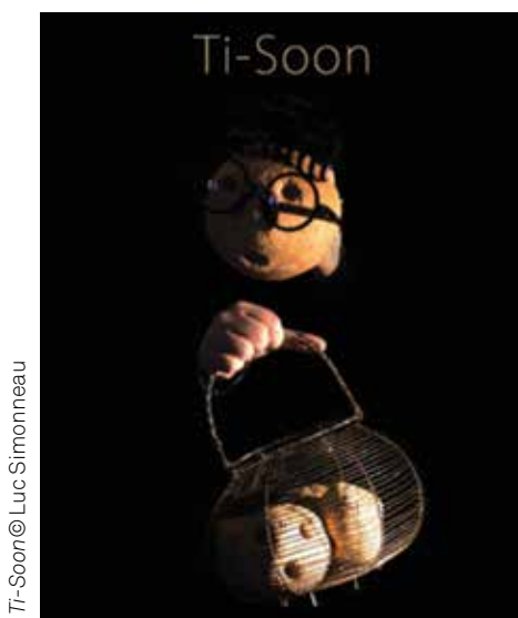
Ti-Soon © Luc Simonneau