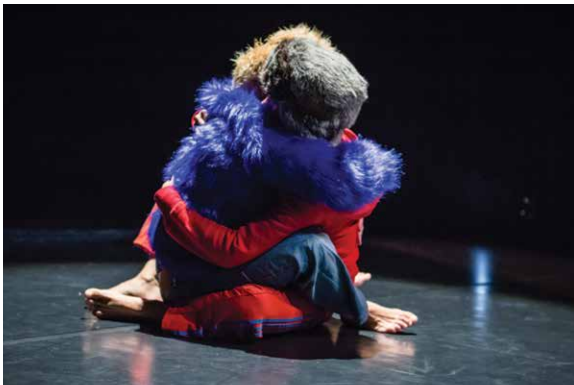
Oursinge © Compagnie Tancarville

« Grâce au soutien d'Enfance et Musique, nous avons eu la chance de participer pour la première fois au Festival Jeune et Très Jeune Public de Gennevilliers en 2017.