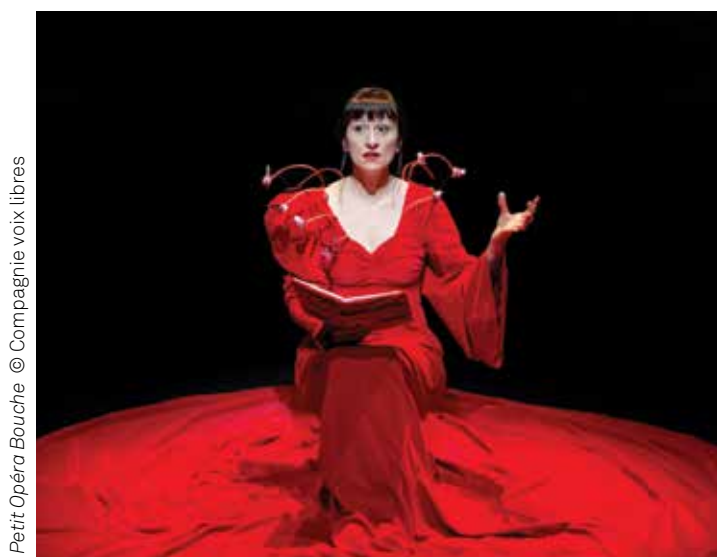
Petit Opéra Bouche

Le Service Spectacles / Jeune Public propose depuis une douzaine d'années à toutes les institutions de la petite enfance et de l'enfance d'accueillir un spectacle dans leur structure. Ce projet mis en place à l'origine pour les crèches qui avaient une interdiction de sortie dans le cadre des plans « Vigipirate » s'est pérennisé au fil des années au vu de l'enthousiasme des partenaires. S'inscrivant dans une volonté politique forte de développer l'éveil culturel dès le plus jeune âge, cette proposition permet d'offrir au plus grand nombre d'enfants un spectacle de qualité, et facilite surtout l'échange artistique entre les compagnies et les professionnels de la petite enfance.